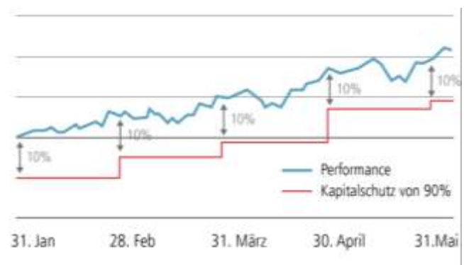
Abbildung 2: Erhöhung des Kapitalschutz-Niveaus bei höheren Monatsendkursen

Jeweils per Monatsende wird geprüft, ob der Kurs des Fonds einen neuen Höchststand erreicht hat. Ist dies der Fall, wird von diesem Wert 90% als neues Kapitalschutzniveau festgelegt (Abbildung 2, rote Linie). Dieser Mindestwert erhalten die Anleger per Ende der Laufzeit des Fonds gemäss Fondsprospekt ausbezahlt, sind gewisse Voraussetzungen erfüllt. Entwickeln sich die Märkte positiv, erhalten die Anleger die Chance, an dieser positiven Entwicklung teilzunehmen (blaue Linie).