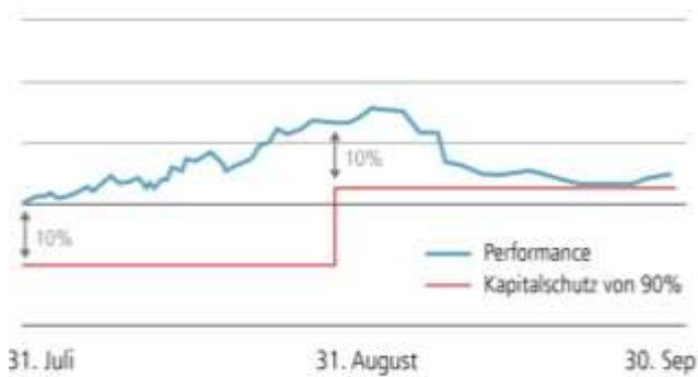
Abbildung 3: Kapitalschutz bei starkem Kursrückgang